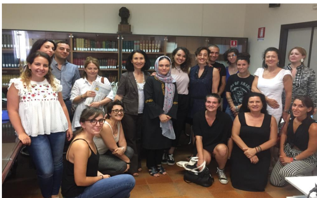
La classe 2017 – I edizione

Alla fine del percorso, ogni partecipante è chiamato a preparare un lavoro finale supportato dall’assistenza di un tutor. Il lavoro finale è presentato di fronte a un’apposita Commissione giudicatrice e dà diritto al conseguimento del titolo e all’attribuzione di 8 crediti formativi universitari . A conclusione del percorso, si tiene la cerimonia di consegna dei diplomi .