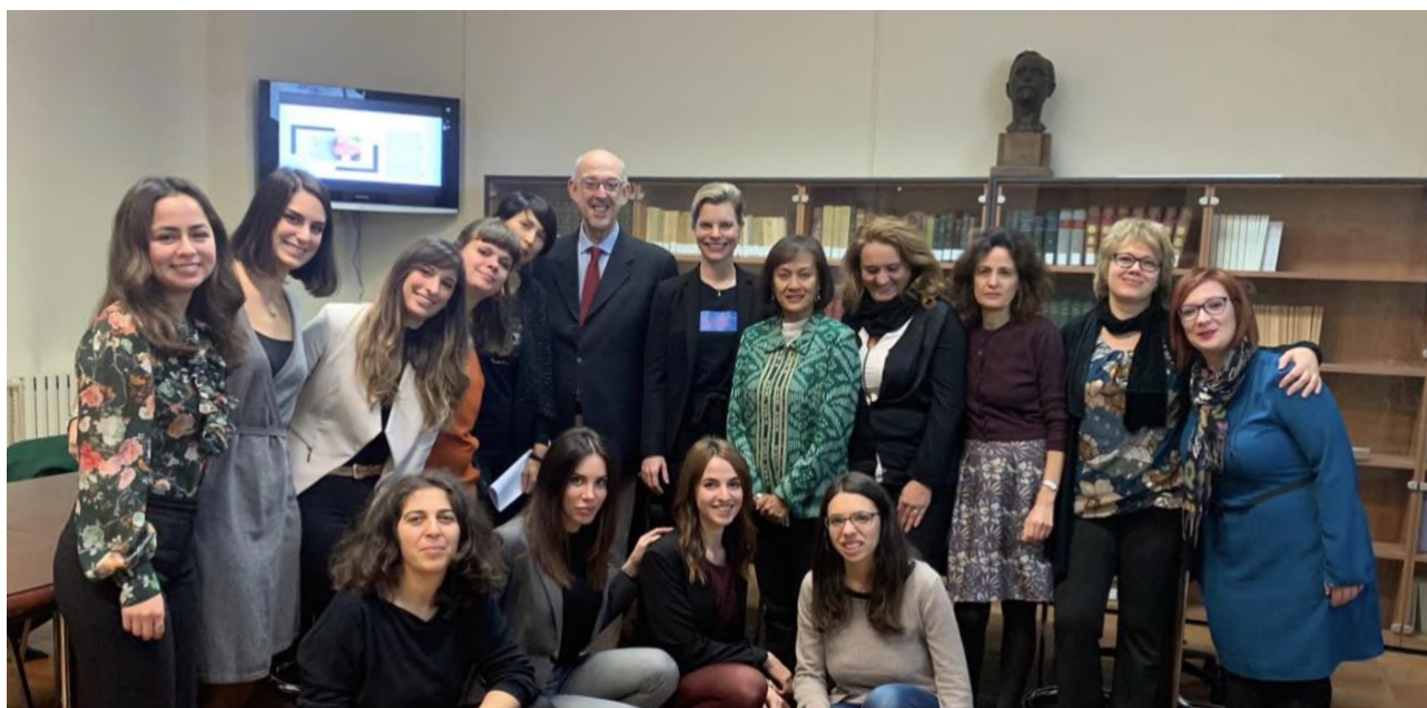
La classe 2018 - II edizione

Possono partecipare al Corso di alta formazione coloro che sono in possesso di laurea di primo livello , laurea specialistica, magistrale o laurea di ordinamento precedente al DM 509/99. Inoltre, possono accedere al Corso gli studenti in possesso di titoli di studio rilasciati da Università straniere, che presentino il diploma corredato di traduzione ufficiale in lingua italiana con legalizzazione e di dichiarazione di valore, in conformità alla circolare del Ministero dell'Università, dell'Istruzione e della Ricerca del 2 agosto 2017.